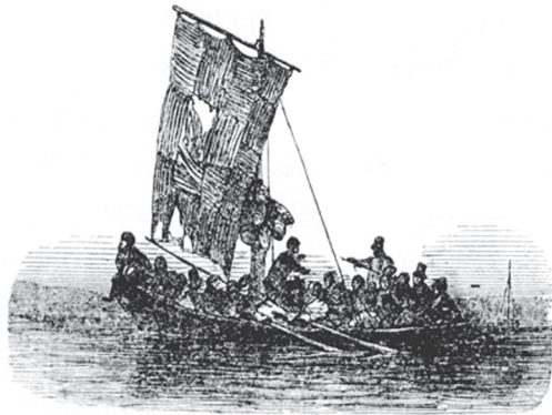
ВОЗВРАЩЕНИЕ БУРЛАКОВ НА РОДИНУ

В ноябре мордовские девицы делают ссыпчину : каждая, достигшая семнадцати лет, выпрашивает у домашних ржаной и гречневой муки, масла, яиц, надевает мужские сапоги и шляпу, увешивает себя теньками на медных цепочках и отправляется недели на две в особый дом, который девицы нанимают за известную плату; также нанимают волынщика, пекут блины и варят брагу. К ним приходят старики и молодые; девицы должны угощать их брагой и блинами