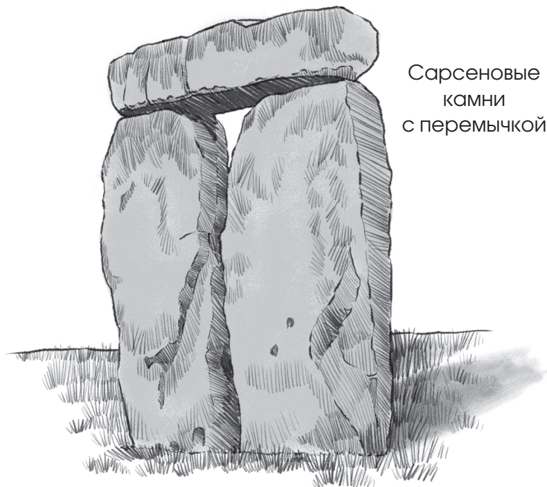
Сарсеновые камни с перемычкой

Некоторые из стоящих камней соединяются трехметровыми каменными балками. Их называют перемычками, потому что они похожи на перемычку или крестовину дверной рамы. Когда-то перемычки связывали все камни в круг.